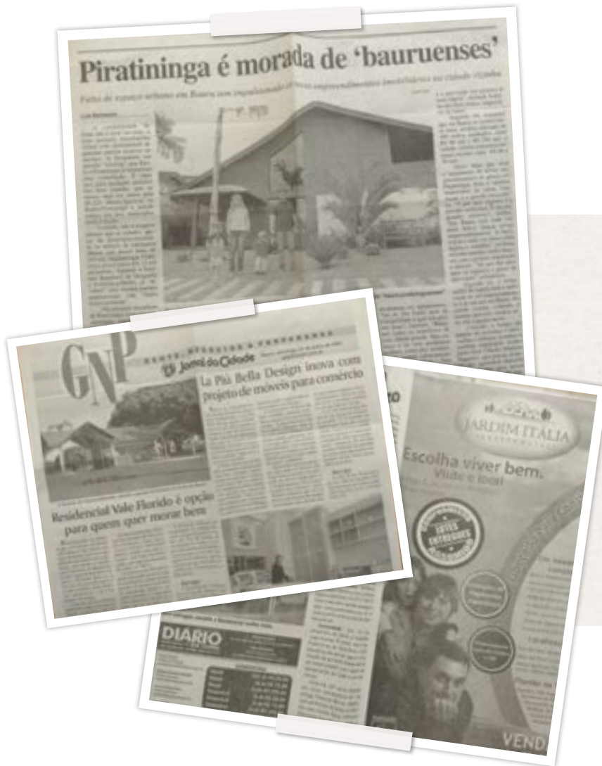
Divulgações em jornais locais dos empreendimentos Residencial Vale Florido e Jardim Itália.