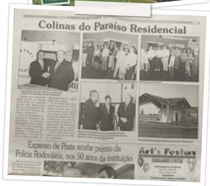
Matérias sobre as os recém lançados empreendimentos Residencial Primavera e Colinas do Paraíso Residencial.