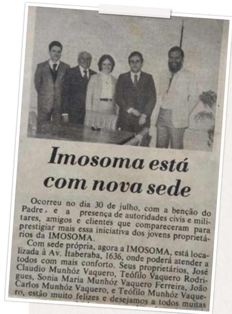
Recorte de revista divulgando nova sede da Imosoma no interior do estado de São Paulo.